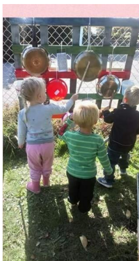
Musik på legepladsen